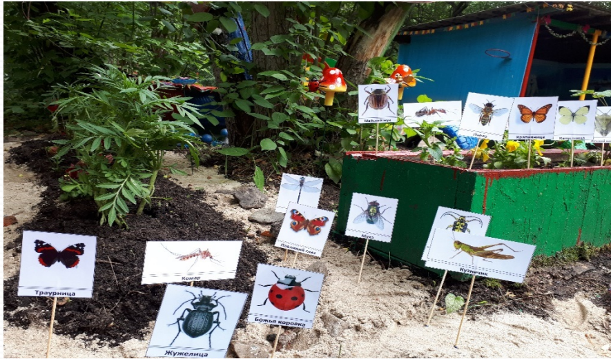
В гостях у Мухи-Цокотухи