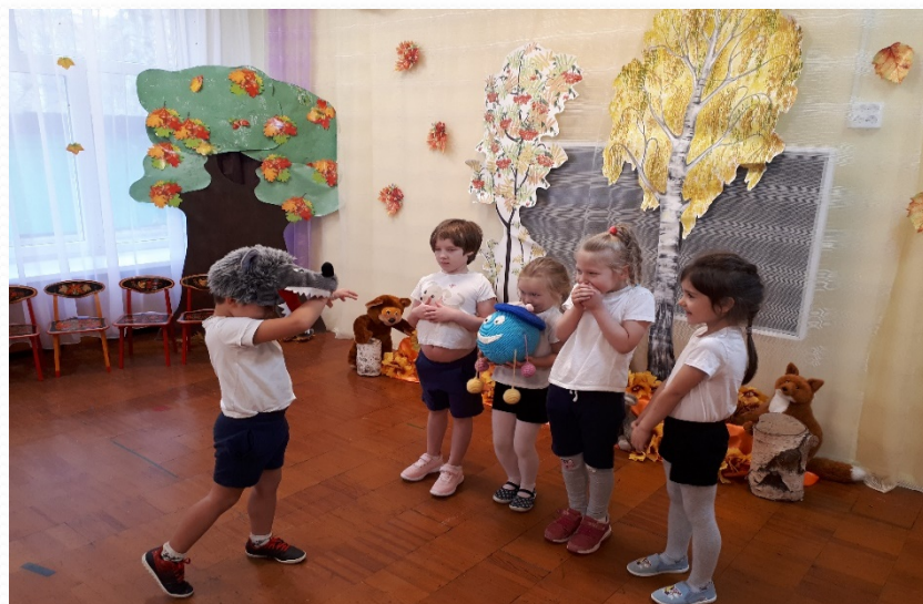
Праздник «Привет, Капитошка»