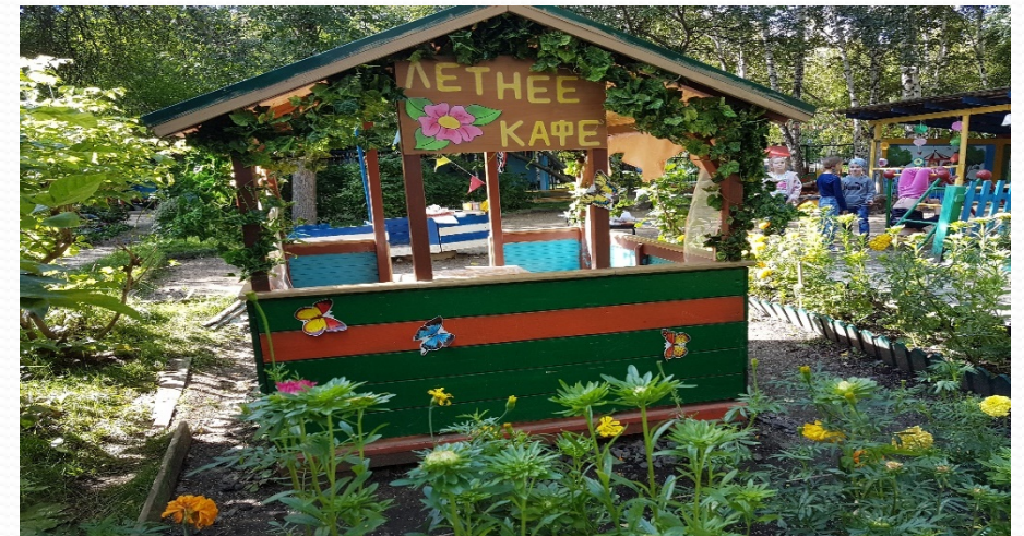
Летнее кафе-веранда «Цветок»