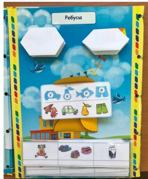
Работа с головоломками: