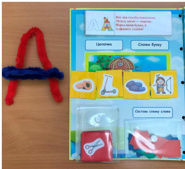
«Выложи букву» Игра «Цепочка» (подбери слова по последнему звуку картинки Абрикос – Самокат_...)