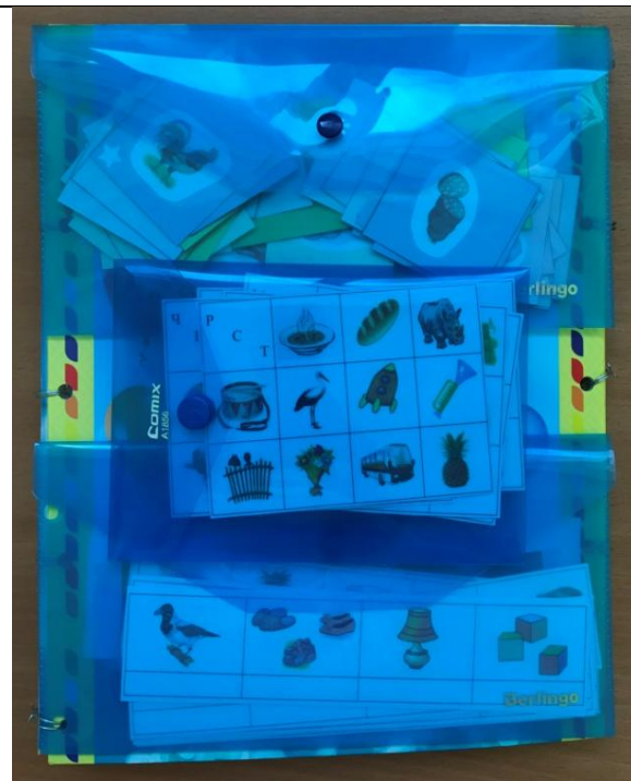
Страница 5 Дополнительный материал с заданиями