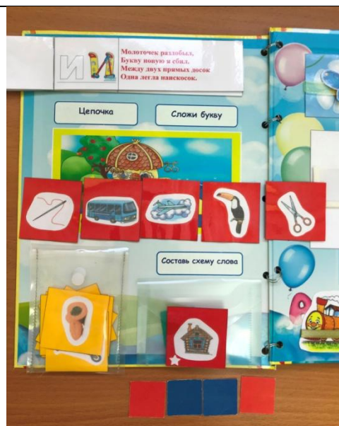
Знакомство с буквой и звуком И Стихотворение про букву И, изображение буквы Игра «Цепочка» (Игла – Автобус - ...) «Схема слова» ИЗБА