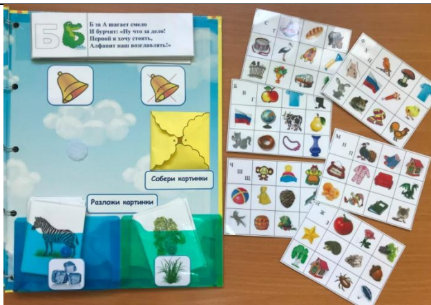
Карточки для задания «Собери картинку»