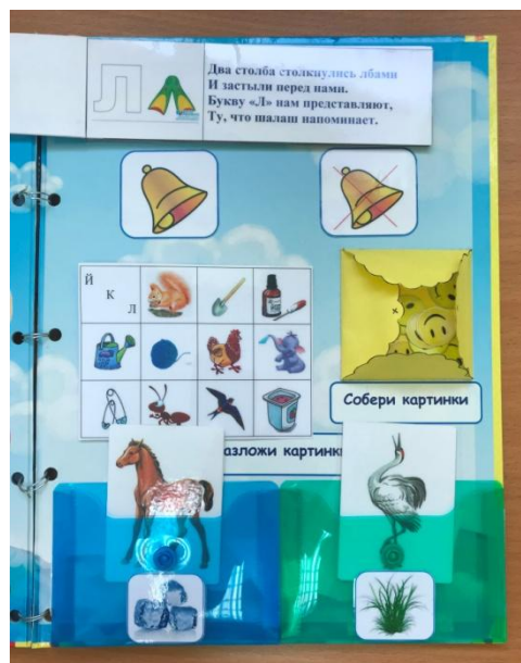
Знакомство с буквой Л (стихотворение про букву, изображение буквы), Характеристика звука – звонкий или глухой? «Собери картинки»: закрывать смайликом картинки, в которых есть звук Л «Разложи картинки»: с твердым Л в синий конверт, с мягким Ль – в зеленый