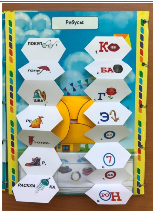
Страница 4 Решение ребусов

Знакомство с буквой Характеристика согласных звуков Подбор картинок к заданному звуку Дифференциация согласных (твёрдый-мягкий)