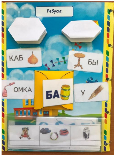
Работа с ребусами